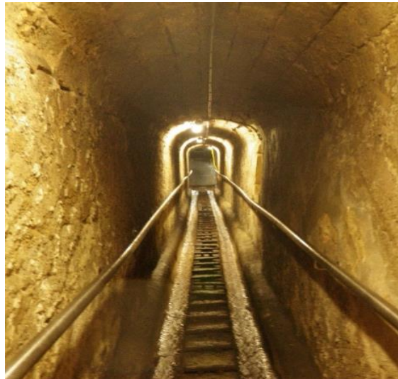
Rathauskanal im Untergrund von Bern

Bei dieser Führung entdecken wir Bern aus einer ungewöhnlichen Perspektive. Unter der fachkundigen Führung von Mitarbeitenden des Tiefbauamtes werden wir durch den Rathauskanal geführt und erfahren viel Wissenswertes über das erste Kanalisationssystem. Nach der Pumpwerkbesichtigung öffnen sich zum Abschluss die Pforten zur Tropfsteinhöhle am Klösterlistutz.