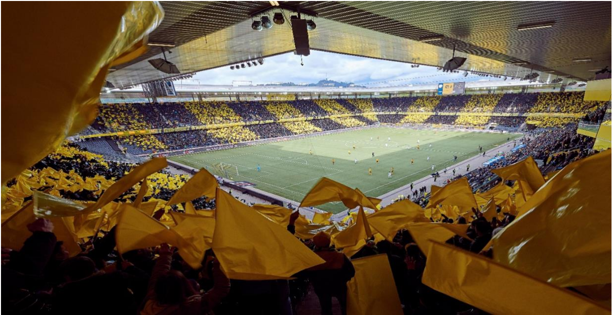
YB-Stadion Ansicht Innen