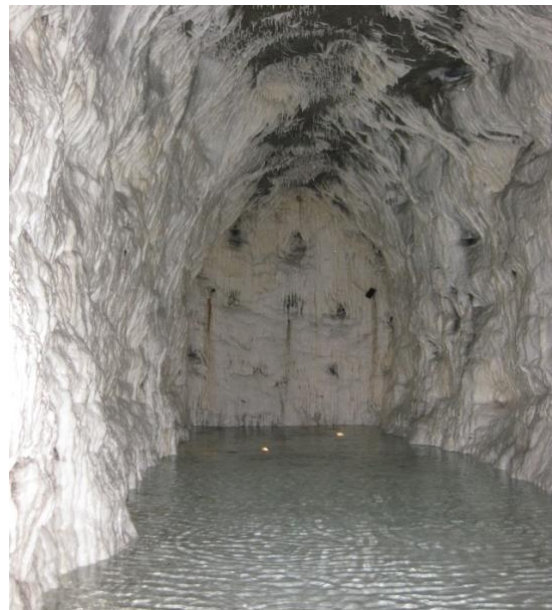
Tropfsteinhöhle im Untergrund von Bern