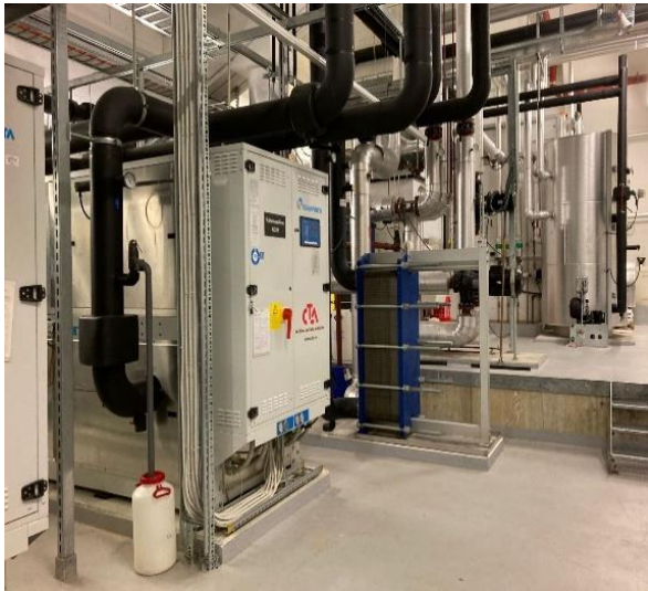
Technikanlage YB Stadion

Es werden interessante Informationen über das Stadion und den BSC Young Boys präsentiert. Wir besichtigen die Aufenthaltsräume der Gästeteams und erhalten einen Einblick in die VIP-Logen. Besonders interessant ist auch der Blick hinter die Kulissen. Wir besuchen die Technikräume und erfahren Details über die Heizungs-, Lüftungs-, Klima-, Sanitär- und Elektroanlagen.