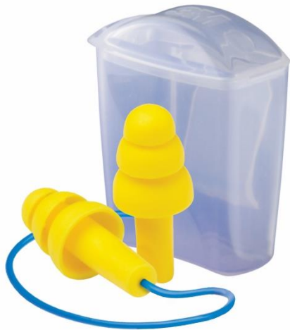
Bouchon à lamelles réutilisable