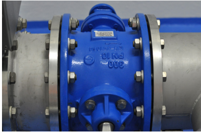
Mit Isolierhülsen aufgetrennte Gussarmatur