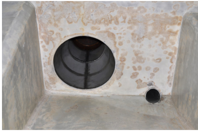
Weiche braune Flecken im Bereich von Chromstahleinbauten